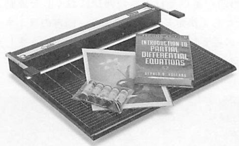
図3. Colibri pocket book カバーシステム

イタリア・コリブリシステム社のコリブリ・ブックカバーシステム（図3）は、書籍・資料にピッタリサイズの糊なしフィルムカバーを非