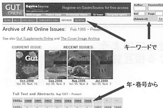
図 2. 雑誌ホームページ例

が、SEARCH で Author、Title 等の項目を入力して検索するか、ARCHIVE (図 2) で発行年・巻号からたどる方法が一般的である。