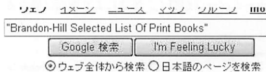
図 3. 検索例

直接、検索エンジン (Google* など) で探すと見つかることがある。雑誌のフルタイトルや論題等のフレーズをダブルコーテーション (") で囲んで検索すると、目的とする情報がヒットしやすい (図 3)。手軽だが、前述した方法と比べて情報の信頼性は劣るので、留意されたい。