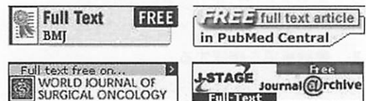
図 4. アイコン例

検索結果からのリンクは完全ではない 6) 。リンクが無い=存在しない、と思い込まずに、雑誌のホームページからも探してみる。