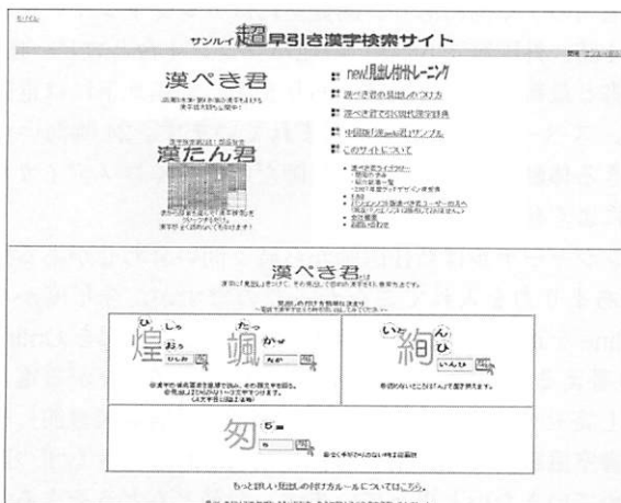
図1 漢ぺき君トップページ