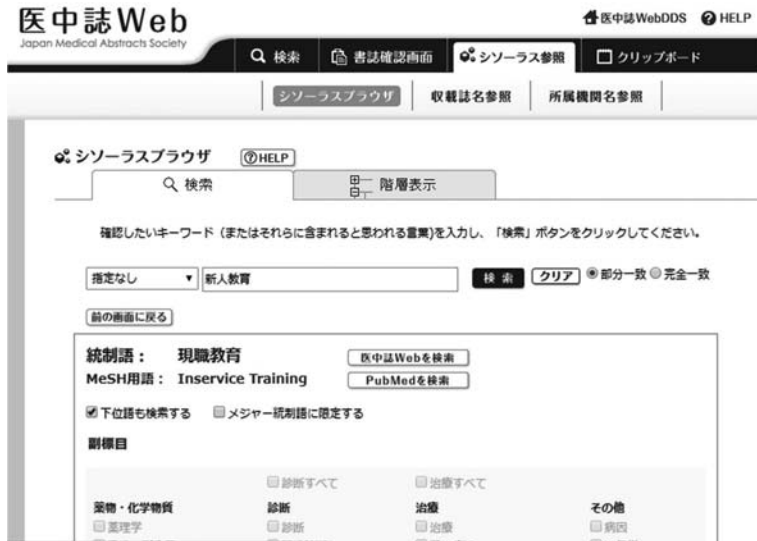
図2 現職教育の詳細画面

「現職教育」をクリックし「キーワードの詳細情報を見る」と詳細画面が表示される (図2)。