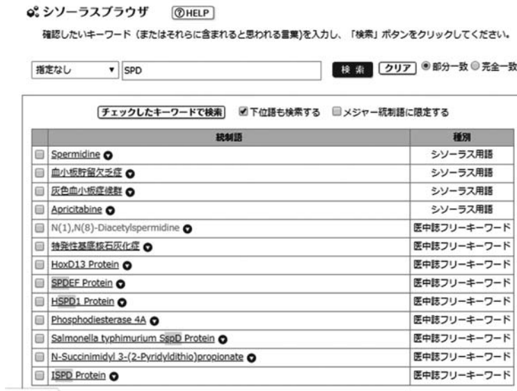
図4 シソーラスブラウザで「SPD」を検索した結果

シソーラスブラウザは便利だが、例えば院内の物流管理を表す「SPD」は探せない（図4）。