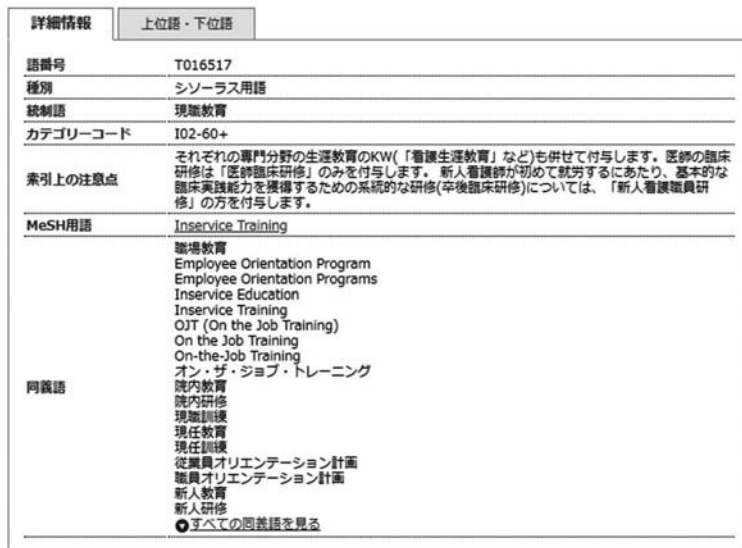
図3 現職教育の「索引上の注意点」画面

「現職教育」をクリックし「キーワードの詳細情報を見る」と詳細画面が表示される (図2)。