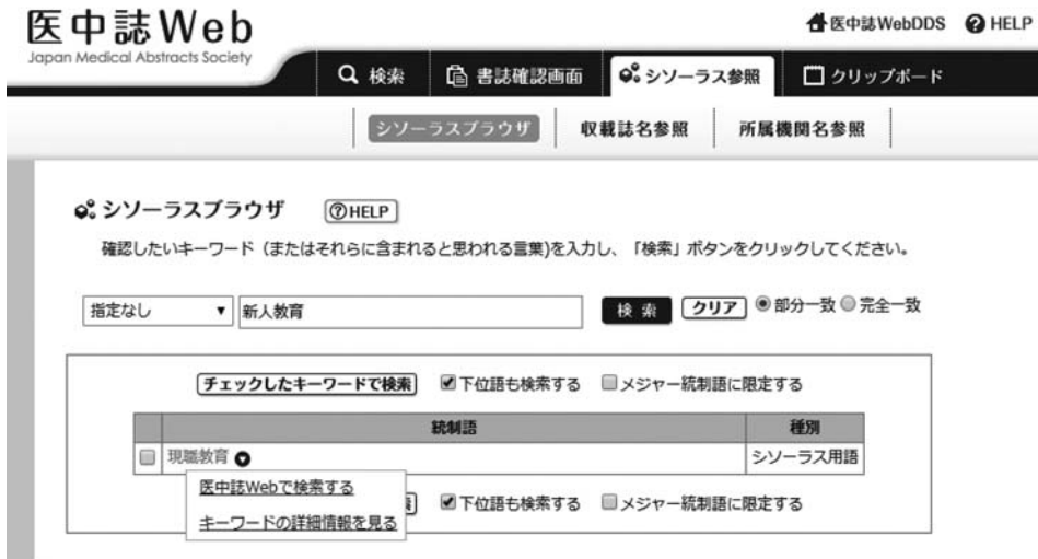
図1 シソーラスブラウザで「新人教育」を検索した結果